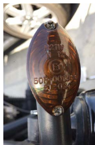
Intermitente E1 50R-001386