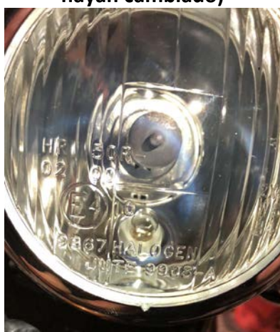
Faro delantero E4 2867

Ejemplo foto marcado homologación. ( Es necesario enviar foto de todos los que se hayan cambiado)