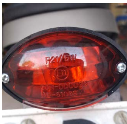
Piloto trasero E11 50R-000099